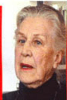
Da sinistra, in senso orario: Hitler e Bormann, Traudi Junge, Andreotti e De Gasperi, Giulio Cesare.